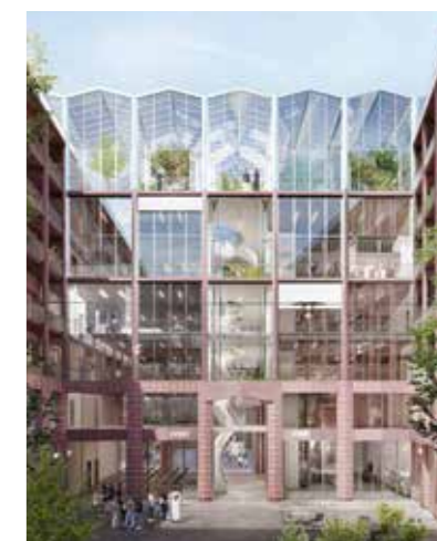
ILLUSTRATION: HILD UND K

„Wo heute noch ein Parkhaus steht, entsteht morgen ein lebendiger Ort der Begegnung und des Wohnens“, so Bausenatorin Özlem Ünsal. Der Abriss ist für 2027 angesetzt – vorher steht eine genaue Bestandsaufnahme an, um bauliche Details zu klären und den umliegenden Geschäften den Zugang zu sichern. Die Stadtentwicklungsgesellschaft BRESTADT erwartet einen positiven Schub für die Innenstadt. Hild und K sind in Bremen keine Unbekannten – ihr preisgekröntes Wohnprojekt in der Neustadt zeigt, dass sie ein Gespür für urbane Räume haben. Laut Baureisort überzeugt der neue Entwurf „durch eine sensible Einbindung in das historische Stadtbild Bremens und seine klare städtebauliche Struktur“. Neben neuer Architektur soll das Projekt vor allem eines bringen: mehr Leben in die Bremer Innenstadt.